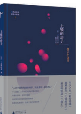
作者:[日]三岛由纪夫 著

内容简介:这本书收录了日本当代文坛大师三岛由纪夫年少至终年30年间风格各异的12篇短篇,其或以从容的笔墨揭示战后各种社会矛盾,或以散文诗般的叙述表达对原始自然灵魂的向往,或以冷酷讽刺的笔调呈现人性的阴暗与扭曲……玲珑的篇幅,迷人的题材,纠缠的情欲,融浪漫、唯美与古典主义于一体,极致地体现了作者的美学造诣。通过此书,可充分地窥探天才作家三岛由纪夫的内内心世界。(本报综合)