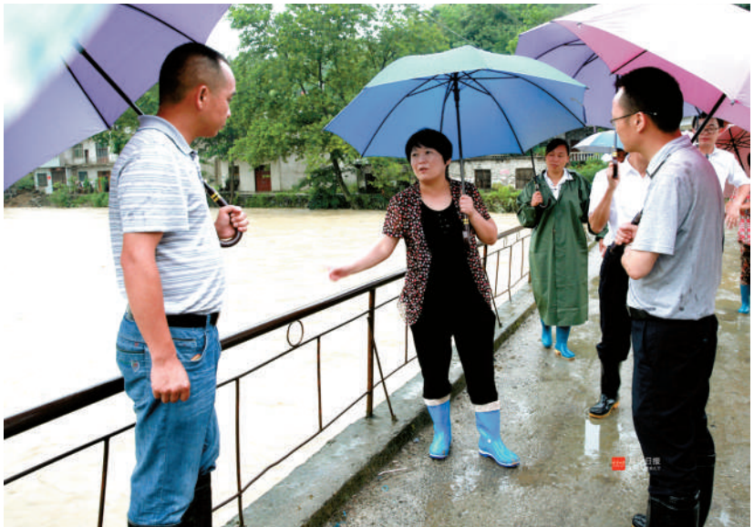
县委书记、人大常委会主任杭莺在高视乡检查指导防汛工作

抓好重点时段、重点区域、重点工程的监测预警与防范工作;要加强应急宣传和培训,开展应急演练,提高政府和群众临灾应对的能力;要加大基础调查工作力度,规范地质灾害防治勘查治理工作;要继续做好汛期监测预警与应急防范工作,密切关注气象雨情、水情信息动态,做到早预防、早预报、早处置,确保人民群众生命财产安全。