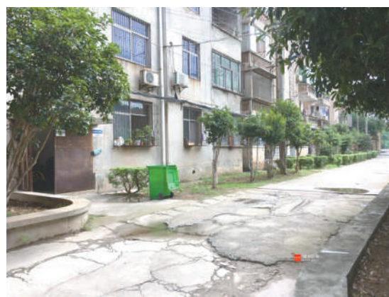
市中医院职工宿舍