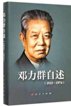
《邓力群自述》 作者:邓力群

内容简介:本书是作者关于自己1915年至1974年六十年间革命经历的叙述。全书共五大部分,内容涉及从老家到北平(桂东老家,从长沙到北平以及投身抗日救亡运动),在延安八年,东北岁月,新疆三年,以及到中央办公厅、参加七千人大会等经历。全书语言简洁、生动,史料价值高,可读性强。