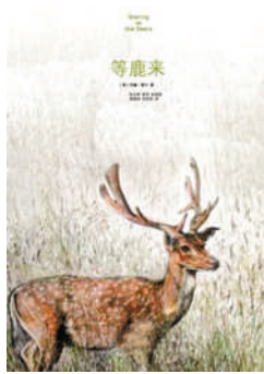
《等鹿来》 作者:(美)约翰·缪尔 (本报综合)

内容简介:本书描写了作者所青睐的两种类型的动物,第一种是作者在美国西部塞拉山脉的约塞米蒂国家公园里所见到的飞禽走兽,突出这些动物的优雅、坚韧和自由精神。第二类是作者成长过程中,见到的一些更为平常的驯养动物,描写了作者与动物之间真挚的情感,以及动物的生与死带给他的深沉的反思。