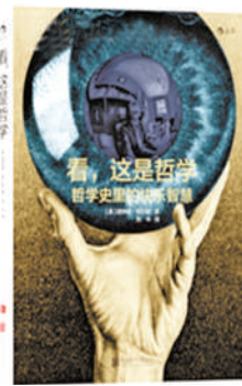
《看,这是哲学》 作者:(美)唐纳德·帕尔默

内容简介:本书是作者教授三十余年哲学导论和哲学史的教学心得之作,用轻松活泼的文风和四百余幅手绘漫画插图,对西方哲学史进行了通俗易懂的概述。作者用风趣幽默的语言减轻了哲学中的难以承受之重,使哲学不再显得无聊难懂。无论对于人文社科学生,还是普通大众,本书都不失为很好的哲学入门读物。