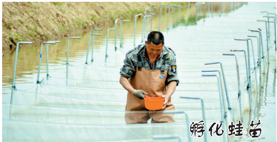
2日,嘉鱼县潘家湾镇龙坎湖村互得利专业合作社,技术人员正在基地里查看蛙苗孵化情况。该基地占地500多亩,是集小龙虾、青蛙养殖和蔬菜种植于一体的生态观光园。