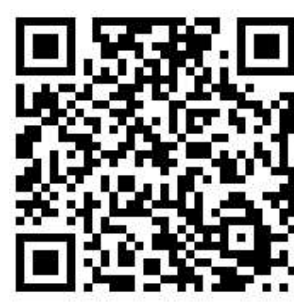
湖北瀛通通讯线材股份有限公司