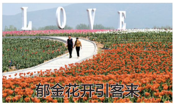
郁金香竞相开放,吸引众多市民游客前来观赏。嵯峨山温泉小镇郁金香园内种植了59个品种的1160万株郁金香,花期将持续到5月初。