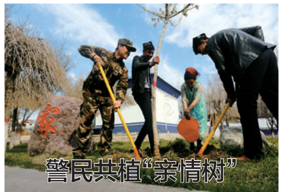
4月11日,新疆公安边防总队伊犁边防支队组织民警与辖区群众共植“亲情树”600余棵,并互留友情链接卡,为绿化当地生态环境助力。 据新华社

4月12日,来自意大利、德国、法国等16个国家的30余位国际风筝高手携自己独具特色的风筝亮相西安大明宫国家遗址公园进行展示切磋,引得游客纷纷驻足。