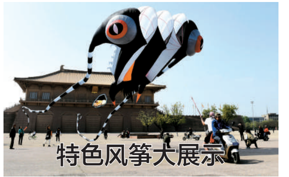
4月11日,衡水市冀州区庄子头村的巾帼志愿者在帮助困难家庭进行麦田管理。眼下正值农忙时节,河北衡水市冀州区庄子头村的巾帼志愿者服务队来到田间地头,义务为需要帮助的孤寡老人、残疾人等困难家庭做农事。 据新华社