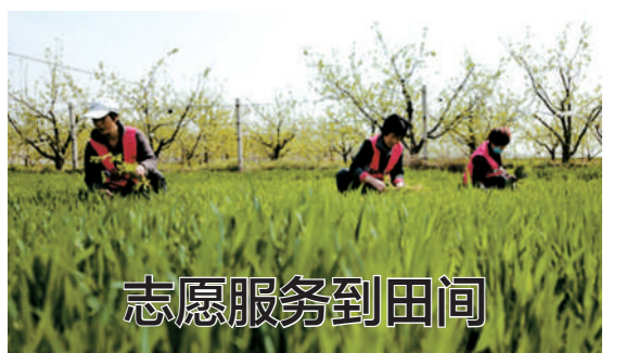
4月11日,衡水市冀州区庄子头村的巾帼志愿者在帮助困难家庭进行麦田管理。眼下正值农忙时节,河北衡水市冀州区庄子头村的巾帼志愿者服务队来到田间地头,义务为需要帮助的孤寡老人、残疾人等困难家庭做农事。