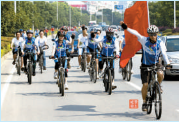
骑行倡导低碳生活