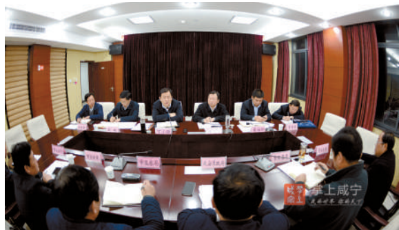
咸宁市中央环保督察迎检工作专题会议。市委书记丁小强,市委副书记、市长王远鹤出席会议并讲话,副市长吴刚主持会议。