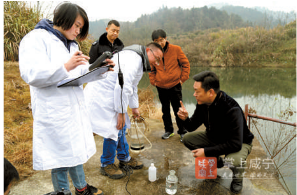
今年1月25日,市环保局局长魏朝东实地检查温泉城区饮用水源地。