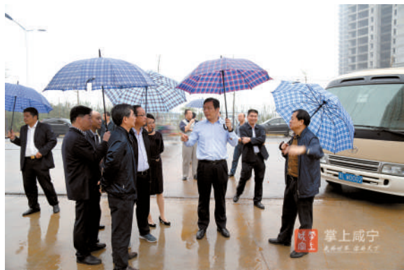
市委书记丁小强督查温泉城区建筑工地污染整治情况。