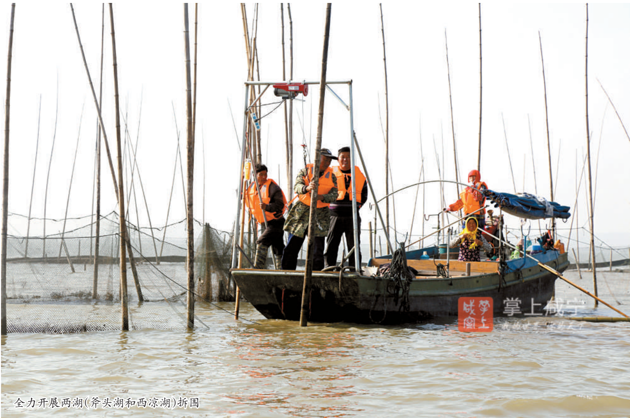
全力开展两湖(斧头湖和西凉湖)拆围