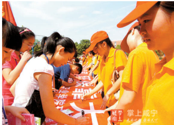
践行绿色生活,共建绿色家园。

桂乡竹翠生态市,碧水蓝天环保城。省委书记蒋超良指出,咸宁作为生态大市,一定要坚持生态优先、绿色发展的理念不动摇,将绿色作为咸宁的底色和本色传承下去。