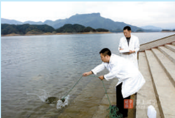
采集饮用水源地水样