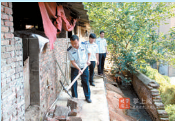
取缔城区违规养猪厂