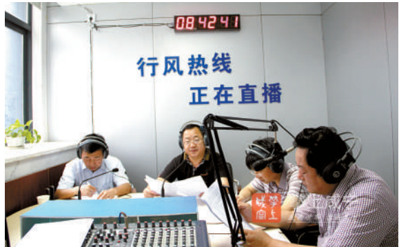
市环保局在线解答市民关注的热点环保问题。