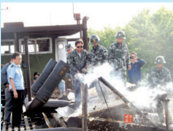
拆除长江采砂装备