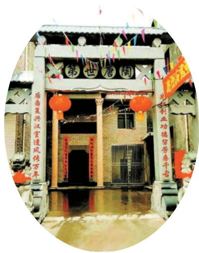
修葺一新的“塘湖故里”

每年大年三十前一天,通城县塘湖镇上万户刘姓人家就开始过年了,一家老小在这一天吃团年饭。