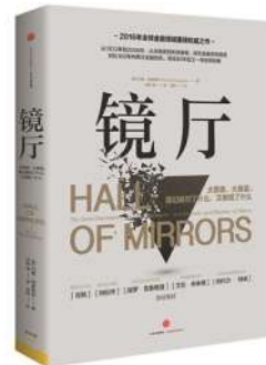
作者:[美]巴里·埃森格林 出版社:中信出版社