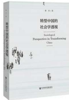
作者:蔡禾 出版社:社会科学文献出版社

生活虽然一地鸡毛,但仍要欢歌高进,成长之路虽有玫瑰有荆棘,但什么都不能阻挡坚强的心,这是生活的艺术,也是人生的真谛。