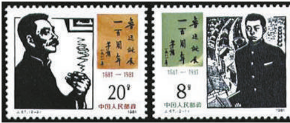
《鲁迅诞辰100周年》纪念邮票。

柳鸣九编选的《萨特研究》出版,被戏称为“80年代新一辈人的精神初恋”的萨特热出现。茅盾文学奖和电影金鸡奖也于此年设立,“金鸡”之名正源于农历鸡年,以金鸡啼晓寄寓百家争鸣之意。