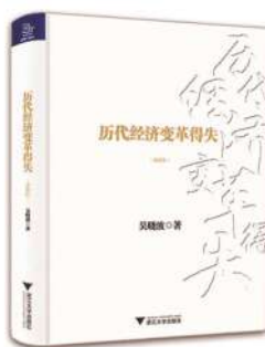
作者:吴晓波 出版社:浙江大学出版社