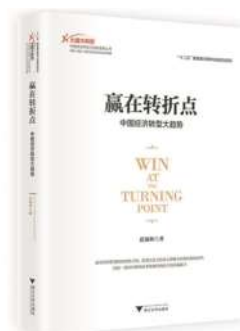
作者:迟福林 出版社:浙江大学出版社