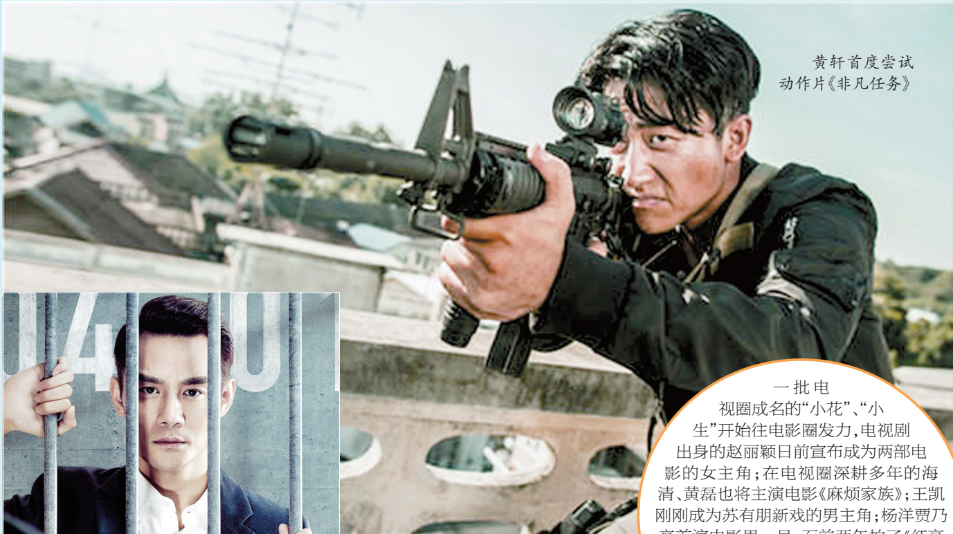
黄轩首度尝试 动作片《非凡任务》