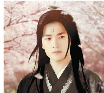
杨洋在《三生三世十里桃花》中