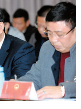
毛联辉委员:要提升工业园区办学条件,推进园区义务教育均衡发展。