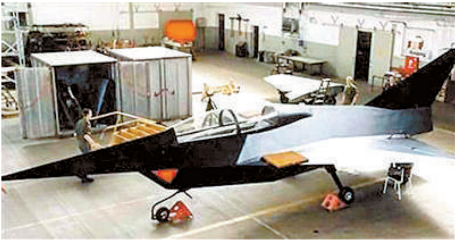
德国 MBB 公司实行灵活上下班制度。

德国一家小型计算机公司的老板解雇了 3 名不吸烟的员工,理由竟是因为这三个人要求得到无烟的环境;而其他吸烟的员工则表示,这不吸烟的三人破坏了他们吸烟的氛围,为了保持公司的“安定团结”,最终老板