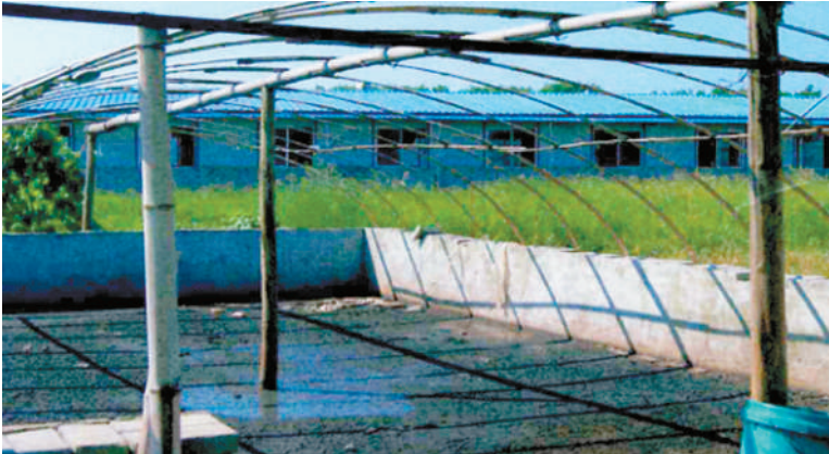
嘉鱼县官桥镇鑫发生态养殖场

嘉鱼县官桥镇鑫发生态养殖场投资20万元,建设沼气池、清水沟、污水沟、堆粪池等无害化处理设施,以及风机水帘。污水管网已基本建成,做到“雨污分离、干湿分离”,干的粪便可作为肥料,沼气则可用于猪舍供暖和自用。