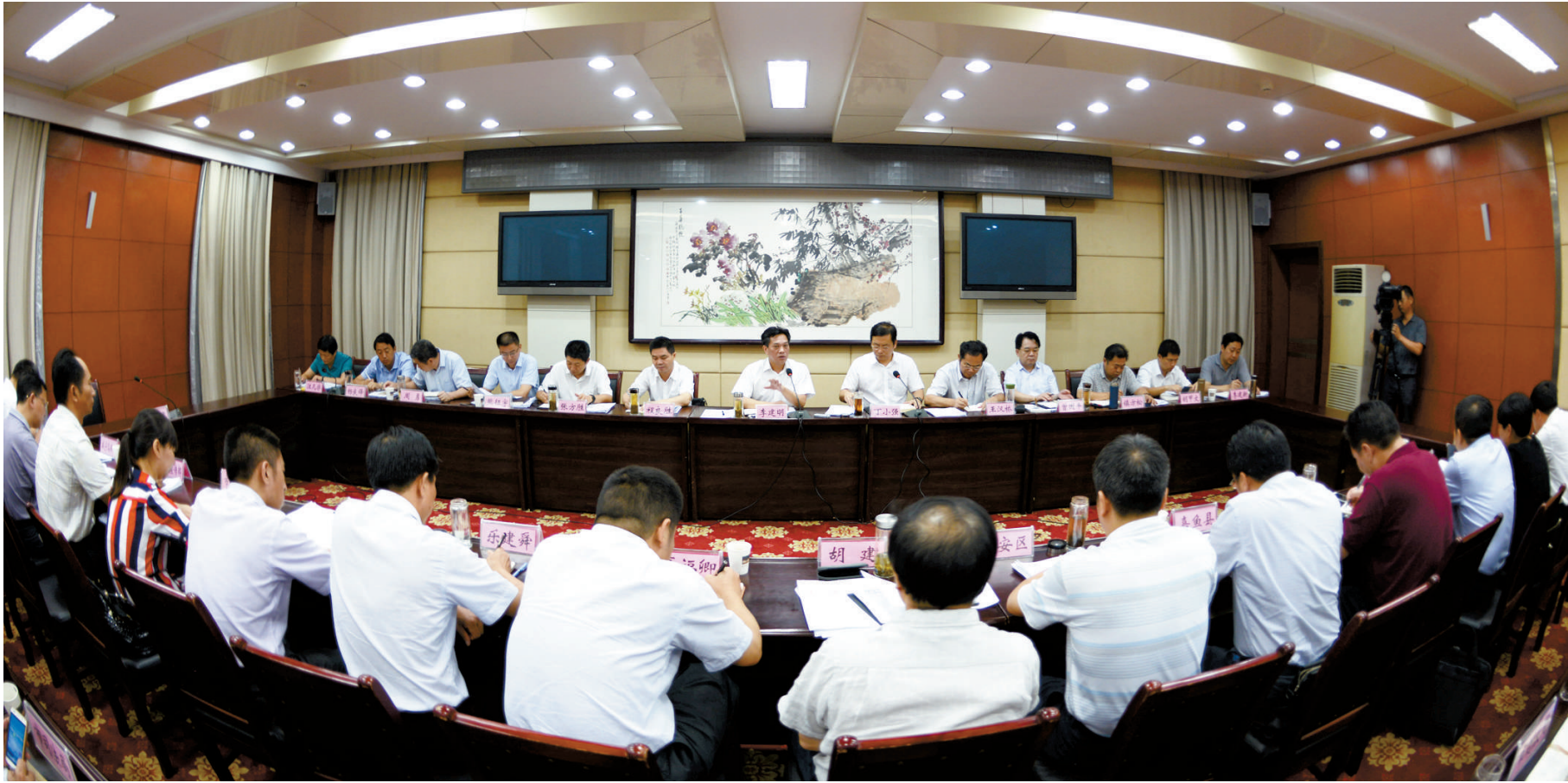
8月22日,市突出问题整治指挥部成立并召开首次会议,打响全市突出问题整治攻坚战。市委书记、市人大常委会主任、指挥部政委李建明发表讲话,市委副书记、市长、指挥长丁小强主持会议。

湖北杭瑞陶瓷有限公司针对原材料在喷雾干燥塔干燥时产生的水蒸气及少量燃煤废气的问题,采用新型工艺,燃煤废气经过旋风+湿法除尘后再由烟囱排放,符合排放要求,并建设初期雨水收集池,彻底实现雨污分流。同时采取消声、隔音、减震措施,减轻煤气发生站粉煤机噪音对外环境的影响;调整煤气发生站粉煤作业时间,避免夜间作业。