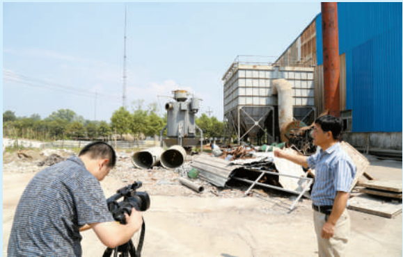
崇阳青山钒铁公司

土壤质量标准、噪音评价标准等环境影响评价最好标准来衡量各项工作;采取措施不拖延,抓好大气、水、土壤环境治理工作,加大秸秆禁烧宣传查处力度,禁鞭依法控制源头,扬尘治理做到24小时监控;抓源头、抓重点、抓关键,突出问题导向,严格按照省环保督查规定,加快推进整改工作进度;对整改工作不到位部门,严肃追责问责,对违法违规建设项目进行查处,对照问题清单,细化责任,确保全市环境质量持续改善,圆满完成目标任务。 截至10月25日,全市突出问题已销号211个,其中,省“双交办”突出问题10个,已销号9个,整改完成率90%;市政府督查突出问题77个,已销号73个,整改完成率94.81%;环保违法违规建设项目159个,已销号129个,整改完成率81.13%。突出问题整治取得成效,市民普遍反映,环境质量变化较大,天蓝了,空气清新了。 (文/陈希子 陈蔚)