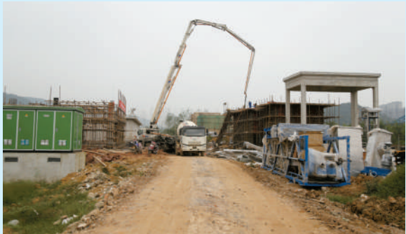
赤壁镇污水处理厂

三八河是咸安经济开发区的母亲河。先前园区企业污水往往经初步处理后,就直接排入了三八河,河水一度污染严重。 开展综合环境治理后,三八河中坝路段,河床淤泥已清理,水流环境明显改善。河道两侧已铺设6千米截污管网,收集开发区内沿河7.4平方公里范围内的工业污水。污水经收集后,全部经由新建的两座污水提升泵站,引至永安污水处理厂处理后达标排放。