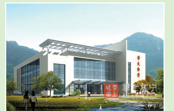
青龙山高中学生食堂