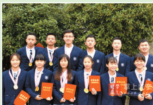
咸宁市第十四届中学运动会青高田径队队员