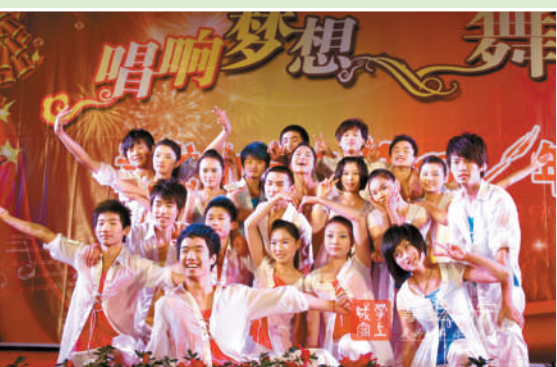
青龙山高中艺术节晚会

近年来,学校先后被评为“全国教育科研先进单位”、“全国课题研究先进单位”、“全省艺术教育工作先进单位”、“省级安全文明校园”、“省级五四红旗团委”、“咸宁市高考备考先进单位”、“咸宁市教学常规管理先进单位”、“咸宁市法治示范学校”、“咸安区文明单位”、“咸安区群众满意学校”等。2011年学校被评为武汉纺织大学优质生源基地,2012年评为湖北美术学院优质生源基地,2013年成为武汉体育学院咸宁市教育实训基地,2014年学校被市政府教育督导室、市教育局授予“咸宁市示范高中”称号,成为咸安区第二所市示范高中。