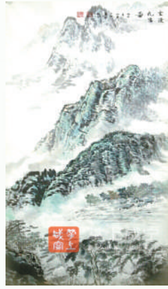
《云漫九宫》严运利作