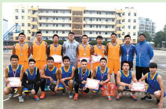
咸宁市第十四届中学运动会青高篮球队教练及队员