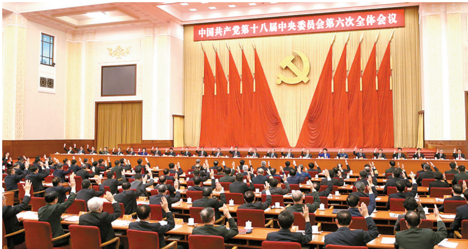
中国共产党第十八届中央委员会第六次全体会议,于2016年10月24日至27日在北京举行。中央政治局主持会议。 据新华社

新华社北京10月27日电 中国共产党第十八届中央委员会第六次全体会议公报(2016年10月27日中国共产党第十八届中央委员会第六次全体会议通过)