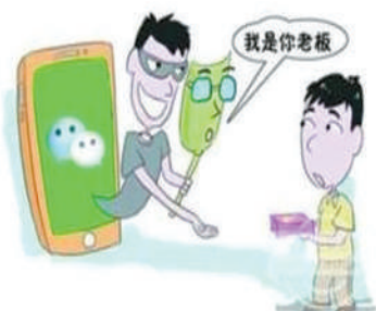
微信冒充公司老总诈骗财务人员