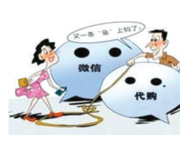
微信假冒代购诈骗