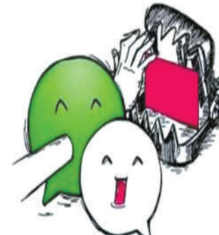
微信假冒代购诈骗