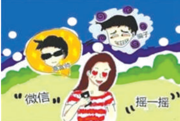
微信伪装身份诈骗