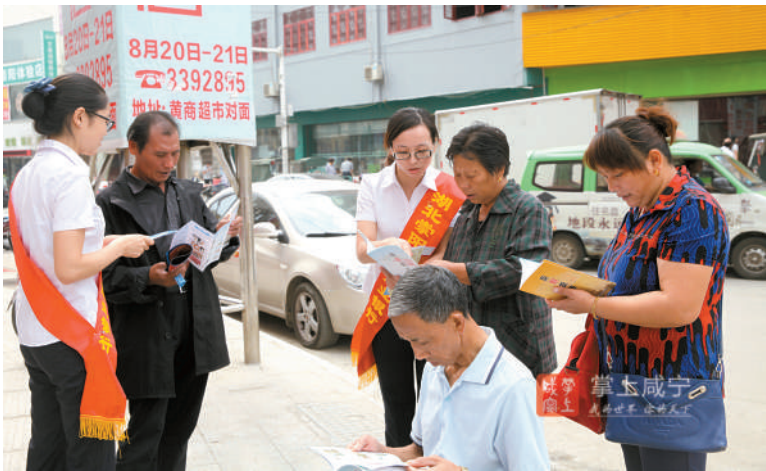
银行工作人员宣传网络安全知识