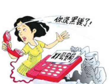
冒充公检法电话诈骗