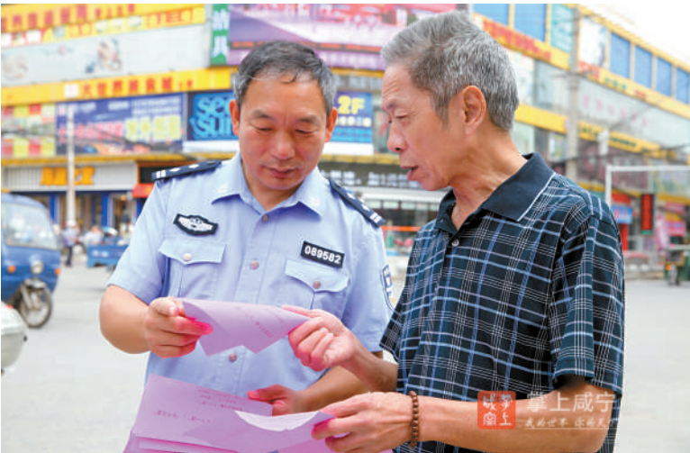
县公安局网安大队民警走上街头宣传网络安全知识