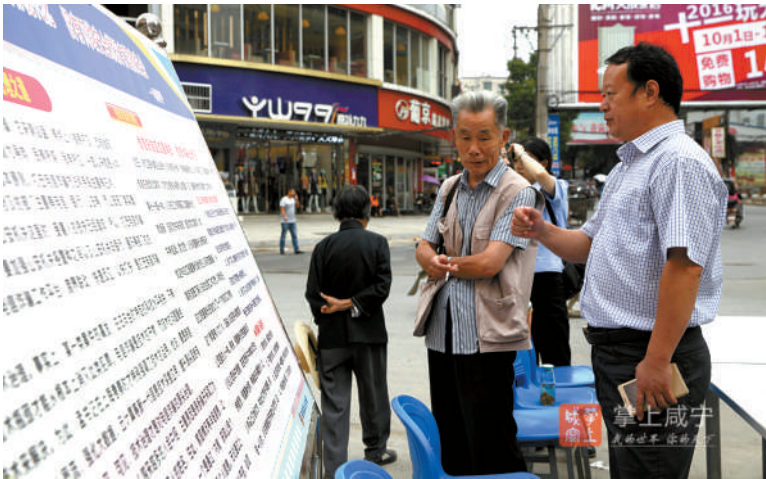
县委宣传部工作人员为市民解释相关网络安全知识

届时,崇阳电视台、《咸宁日报·崇阳周刊》、崇阳新闻网将开辟专题专栏,宣传网络安全相关知识和网络安全宣传公益广告。“崇阳发布、崇阳热线”等两微一端,将制作网络防诈骗专栏,给群众讲解分析网络诈骗案例,向公众剖析案例中的关键环节揭露网络诈骗常见手段和方法,增强社会公众网络安全意识,提高社会公众防范网络诈骗的意识与技能,让“网络安全为人民,网络安全靠人民”的观念深入人心。