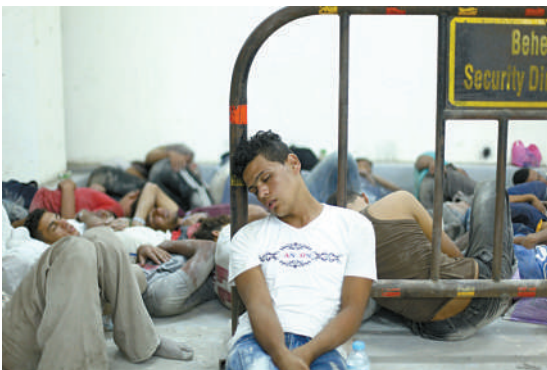
9月22日,在埃及拉希德地区,沉船事故部分幸存者在一警察局内休息。一艘载有约600名非法移民的船只21日在埃及北部地中海海岸附近沉没,目前沉船事故已致112人遇难。

据新华社平壤9月22日电 朝鲜人民军总参谋部发言人22日谴责美军B-1B型轰炸机飞越韩国上空,称将“以军事打击粉碎美韩反朝挑衅妄动”。 据朝中社22日报道,发言人发表声明说,近日两架美军B-1B型轰炸机在朝韩军事分界线附近空域飞行,进行核弹投放训练,其中一架还降落在韩国乌山空军基地。 发言人指出,朝鲜的革命武装力量已经进入“决战态势”,以遏制美韩试图对朝发动先发制人军事打击。“美韩避免遭受朝鲜无情打击的唯一方式,就是不要触犯朝鲜的尊严和安全,慎重对待朝鲜的警告。”