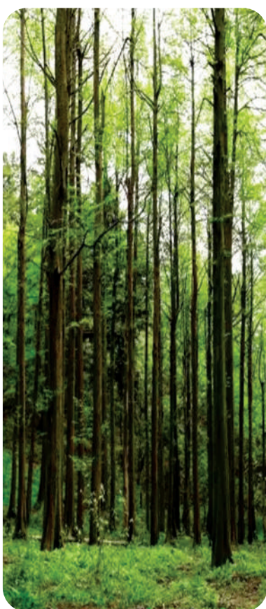
随处可见的参天大树

走在幽静的丛林里,丝丝清凉袭来,原始的风景让思绪飞扬,那种古老的浪漫,犹如就在身边的某棵古树上。