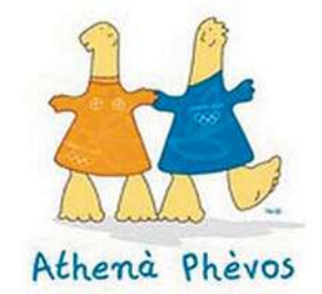
2004年雅典奥运会吉祥物Athena和Phevos。