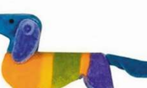
1972年慕尼黑奥运会吉祥物Waldi。