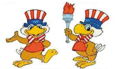
1984年洛杉矶奥运会吉祥物Sam。