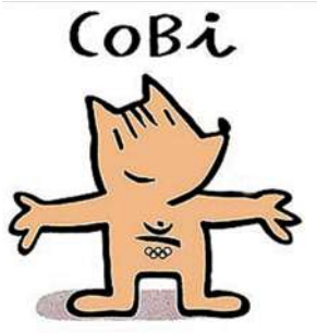
1992年巴塞罗那奥运会吉祥物Cobi。