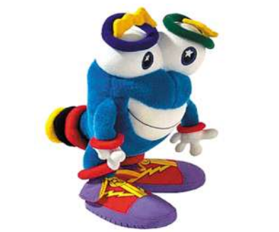
1996年亚特兰大奥运会吉祥物Izzy。