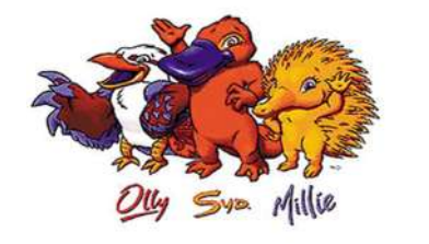
2000年悉尼奥运会吉祥物Olly、Sid和Millie。