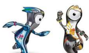
2012年伦敦奥运会吉祥物Wenlock。