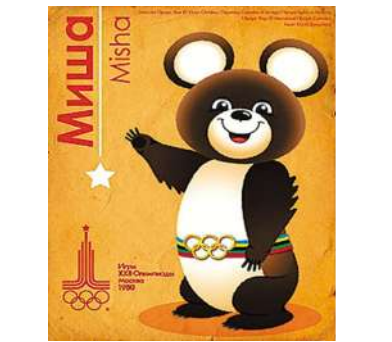
1980年莫斯科奥运会吉祥物Misha。