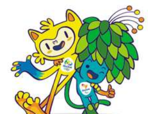
2016年里约奥运会吉祥物Vinicius。