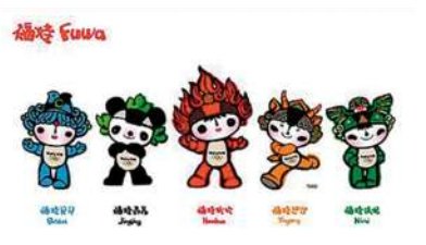
2008年北京奥运会吉祥物福娃。