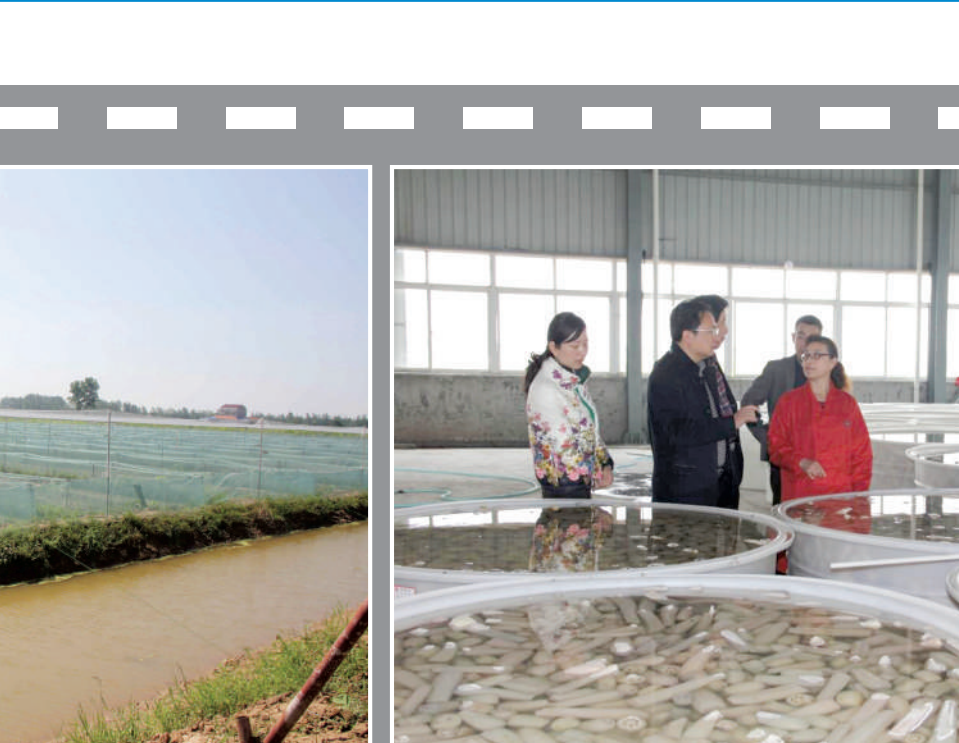
县领导到嘉珍生态农业发展有限公司调研龙头企业带动贫困户脱贫情况

200元标准奖补”。陆溪镇率先成立合作社,整合扶贫项目资金和“一事一议”项目奖补资金100多万元,支持花园村建起标准化红薯加工厂,“村集体通过公开招标吸引庆林薯业公司进驻,由公司带头人投资建设红薯基地1000亩,带动辐射周边田山、虎山、铜山1300多户农户,种植红薯9000亩,由公司直接与农户签订收购协议,带动210余户贫困户参与红薯种植加工务工,户均年增收2000元以上,村集体通过厂房出租年增收5万多元。