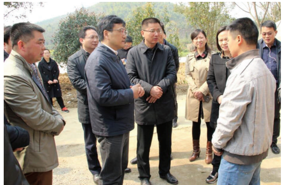
市委副书记吴晖等领导来嘉鱼调研产业扶贫