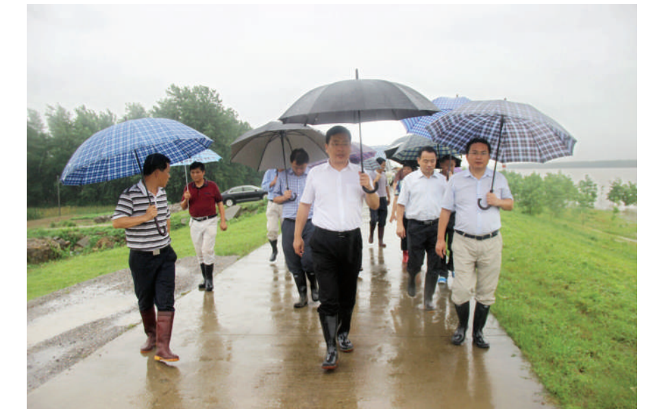
市长丁小强冒雨检查嘉鱼县扶贫救灾情况