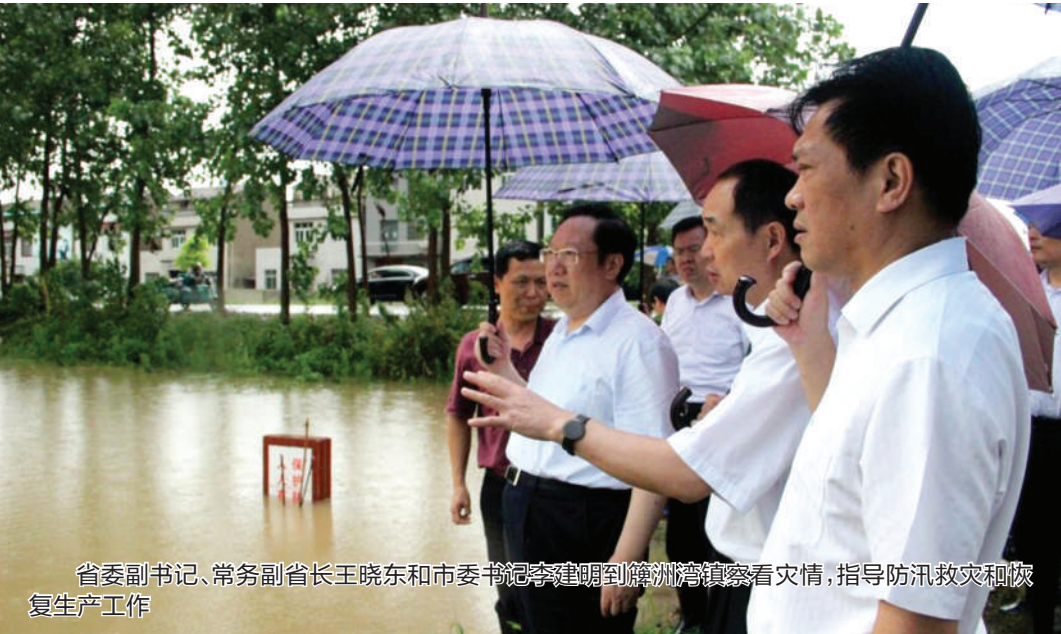
省委副书记、常务副省长王瑞东和市委书记李承奎到随州指导防汛救灾和恢复生产工作

近一年来,嘉鱼县委县政府严格按照“精准扶贫,不落一人”的总要求,遵循市委市政府在全省率先全面建成小康社会的部署,“立军令”,“挂图作战”,自我加压,奋发作为,谱写了一曲亲民助民富民的华美乐章,开创了一项项扶贫助贫脱贫的特色产业,讲述了一个个鲜活、生动感人的嘉鱼故事。