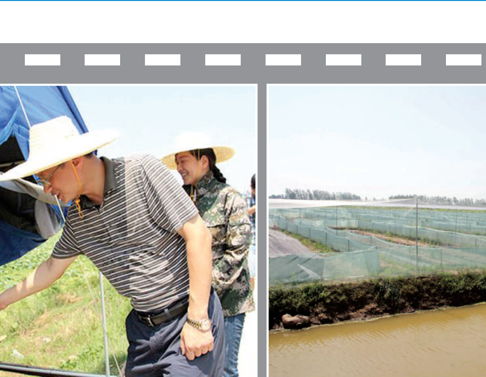
潘家湾镇头墩村互得利种养殖专业合作社青蛙养殖基地