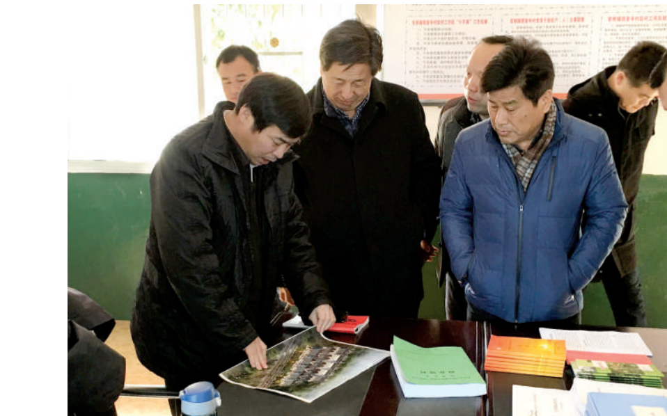
国务院扶贫办信息中心主任刘文俊来嘉鱼调研

近两年来,嘉鱼县委县政府紧紧围绕“精准扶贫,不落一人”的攻坚目标,坚持把产业扶贫作为全县脱贫攻坚的硬仗来打,按照“平原粮菜、滨湖鱼虾、丘陵红萝卜和油茶”的布局,拿出4500多万产业发展专项资金,出台了八项产业奖补措施,开展了深度挖掘产业扶贫的“药方子”。全县8个镇、82个行政村积极响应,照方抓药,对症下药,精准施策,产业扶贫成效显著。