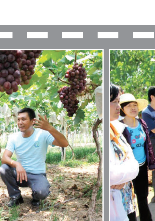
县四大家领导到各镇产业扶贫工作点进行拉练检查