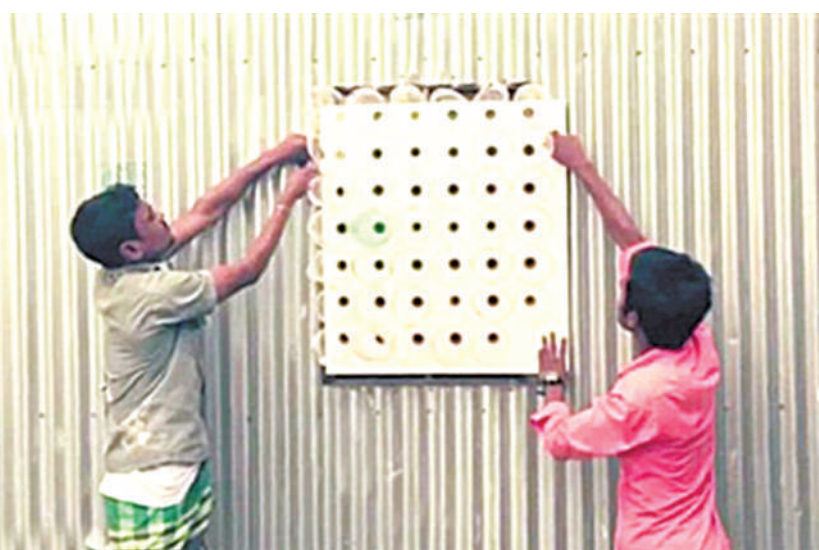
网帖中的孟加拉国居民在制作“生态空调”。