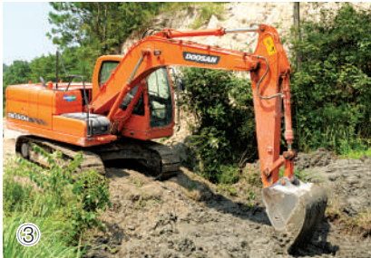
图①:柏树村村民投劳抢修路面。 图②:损毁的五甲祠堂桥旧桥被拆除。 图③:仙姑村组织挖掘机修复边坡。