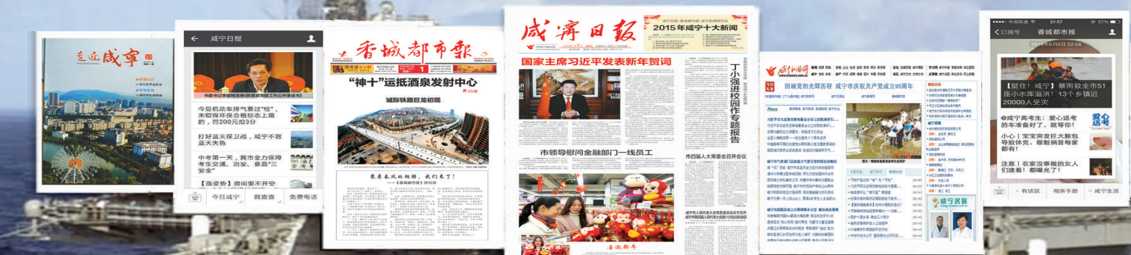
咸宁日报传媒集团

背景资料:2014年7月,《咸宁日报》迎来了新的里程碑:省委宣传部、省新闻出版广电局下文批准组建咸宁日报传媒集团,咸宁日报社成为全省市州第8家组建传媒集团的报社。目前,咸宁日报传媒集团拥有多个新闻传播平台:两张报纸——《咸宁日报》、《香城都市报》;两个网站——咸宁新闻网、咸宁政府网;一份杂志——《走进咸宁》画报;7个媒体官方微博、4个微信公众号和《湖北手机报咸宁版》;在市区主要街道、公共场所建有94块阅报栏、80多块数字媒体显示屏。集团注册组建了广告、印务、传媒等子公司。目前集团在编在岗人员200余人(其中有高级技术职称人员18人,中级技术职称人员13人),年综合经营收入3000万元。咸宁日报已成长为掌握和应用现代传媒技术、颇具经济实力的报业传媒集团。