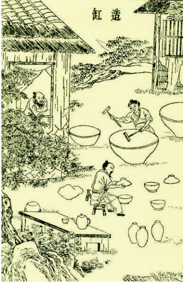
古代陶缸生产教学现场

有明确规定,工艺要求高的制作珠宝的钿镂专业学生,须学习四年才能出师,即现代所谓的“毕业”。出师时并不是师傅说了算,须考试:“四季以令丞试之,岁终以监试之。”为防弄虚作假,这些学生在学习期间所制作的物件上均要刻上自己的名号,即所谓“皆物勒工名”,以备查考。但唐代对于简单易学、水平要求不高的专业,也可以缩短学制。如制作衣冠的“冠冕弁帻之工”,学满9个月就可以出师。