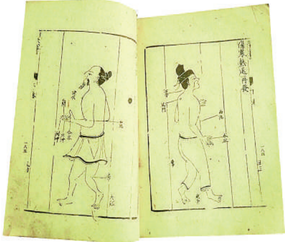
古代针灸教学用书

咒禁三博士,教授职业技能。在隋朝的基础上,唐朝专业分科更细化为“医”、“药”二部。各科均由博士、助教给学生上课,《本草》、《脉经》为学生必修课。学完基础课后,再细分具体专业,有体疗、疮肿、少小、耳目口齿和角法等五个专业。此外,唐朝还一度在地方各州推广职业教育,并开设了农业畜牧业需要的兽医专业,一次可招学生100名。