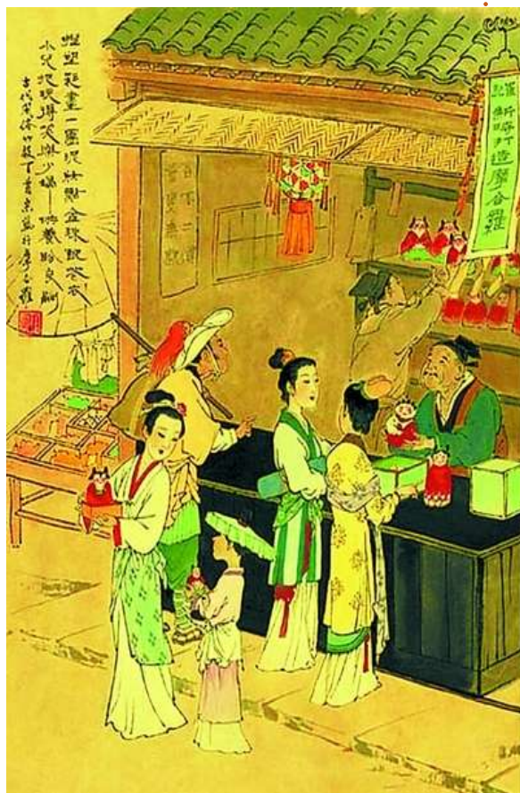
购买磨喝乐(古代风俗画)

明清时泥塑玩具更多,北京、天津、杭州、苏州、无锡、郟州等许多地方,都出现了“泥塑之乡”,至今不衰。