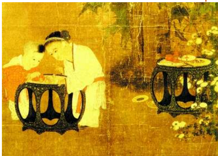
南宋苏汉臣绘《秋庭戏婴图》(局部),两儿童正在玩玩具,后面桌子上、地上都有玩具。

古代逢年过节,家长也会送玩具给孩子图个高兴,由此还形成了最有中国特色的“节令玩具”。古代的节令玩具很多,如春节有“花炮”,元宵节有“花灯”、清明有“黄胖”、端午有“布老虎”、中秋有“兔儿爷”等。