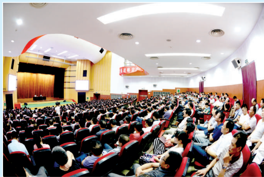
市委组织县级以上干部学习新环保法