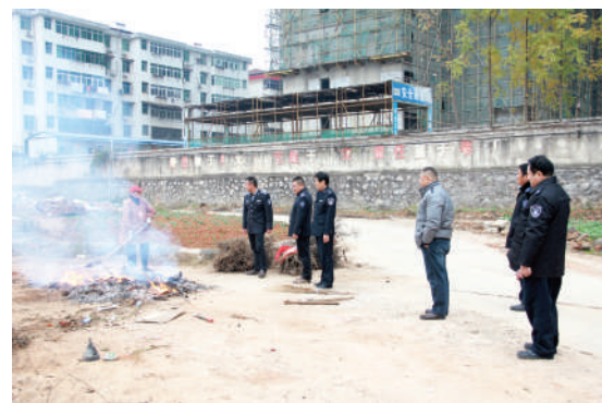
环境监察人员焚烧