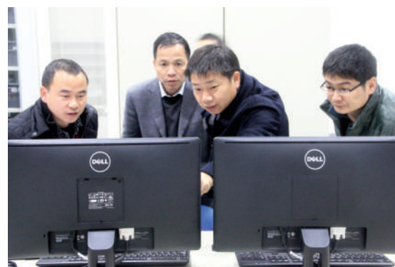
督查企业减排工作