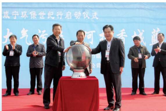
市领导启动咸宁环保世纪行大气污染防治行动