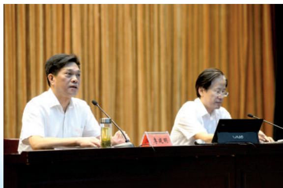
市委书记李建明主持新环保法专场报告会