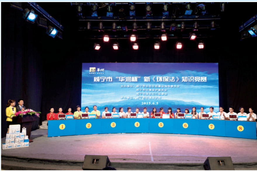
全市重点企业新环保法规竞赛