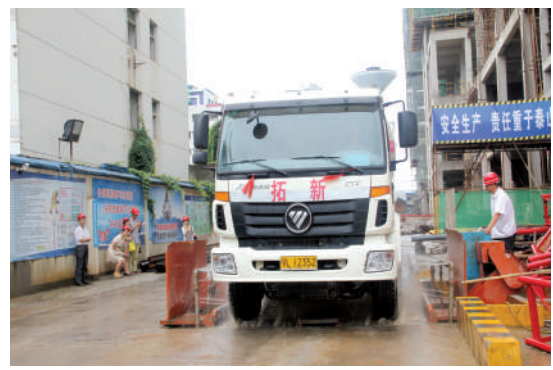
监管建筑工地除尘设施运行