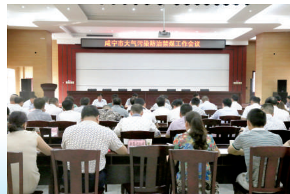
市政府召开大气污染防治联席会