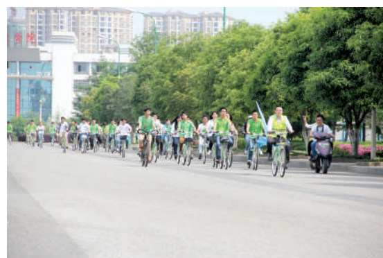
大学生倡导低碳出行