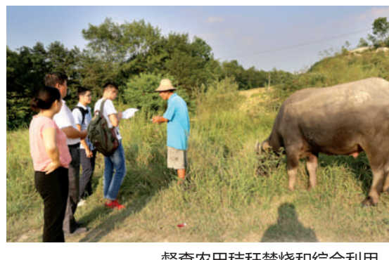
督查农田秸秆焚烧和综合利用