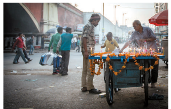
昨日,在印度新德里,小贩点亮象征光明、繁荣的蜡炬庆祝排灯节。排灯节是印度教四大节日之一,按照习俗,印度民众会在节日前后用象征光明、繁荣和幸福的灯光、烛火、金盏花串装饰住宅。(据新华社)