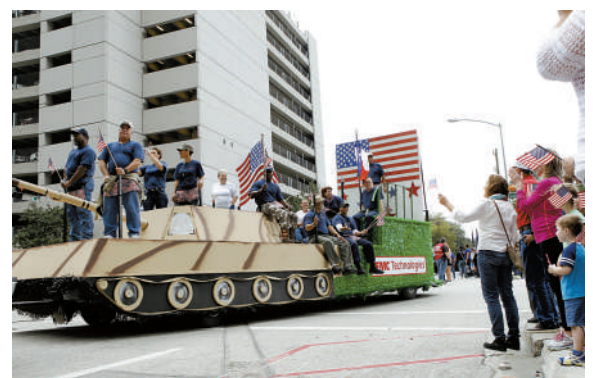
昨日,在美国休斯敦市,人们观看退伍军人日游行活动。当日是美国退伍军人日,休斯敦市在市政广场举行了纪念活动。(据新华社)

据新华社斯德哥尔摩11月11日电 瑞典政府11日宣布,将对边境实施为期10天的临时管控,以应对不断涌入的难民带来的巨大挑战。 据瑞典电视台当天报道,因难民人数不断增加,瑞典移民局已不堪重负,不得不提请政府实施边境管控。因此,瑞典政府决定,将从当地时间12日12时(北京时间12日19时)起实施为期10天的边境管控。 瑞典内政大臣安德斯·于耶曼在当天召开的新闻发布会上说,边境管控今后也可能延长至20天甚至更长时间,边境管控是否继续延长取决于移民部门和警方对难民涌入情况的判断。