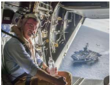
美国防长搭乘“鱼鹰”登上核航母

美国作为南海域外国家,却偏要频繁在亚太地区附近出没。在南海周边,有多少美军的军事存在在虎视眈眈呢?