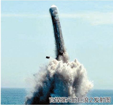
官媒曝光的巨浪2发射图

据美国媒体报道,中国最新型的094级战略导弹核潜艇可能已开始战斗巡逻。美国五角大楼发言人波尔中校今年年初时也曾评论称,“巨浪2”导弹“让中国首次获得了可靠的水下远程核威慑力”。