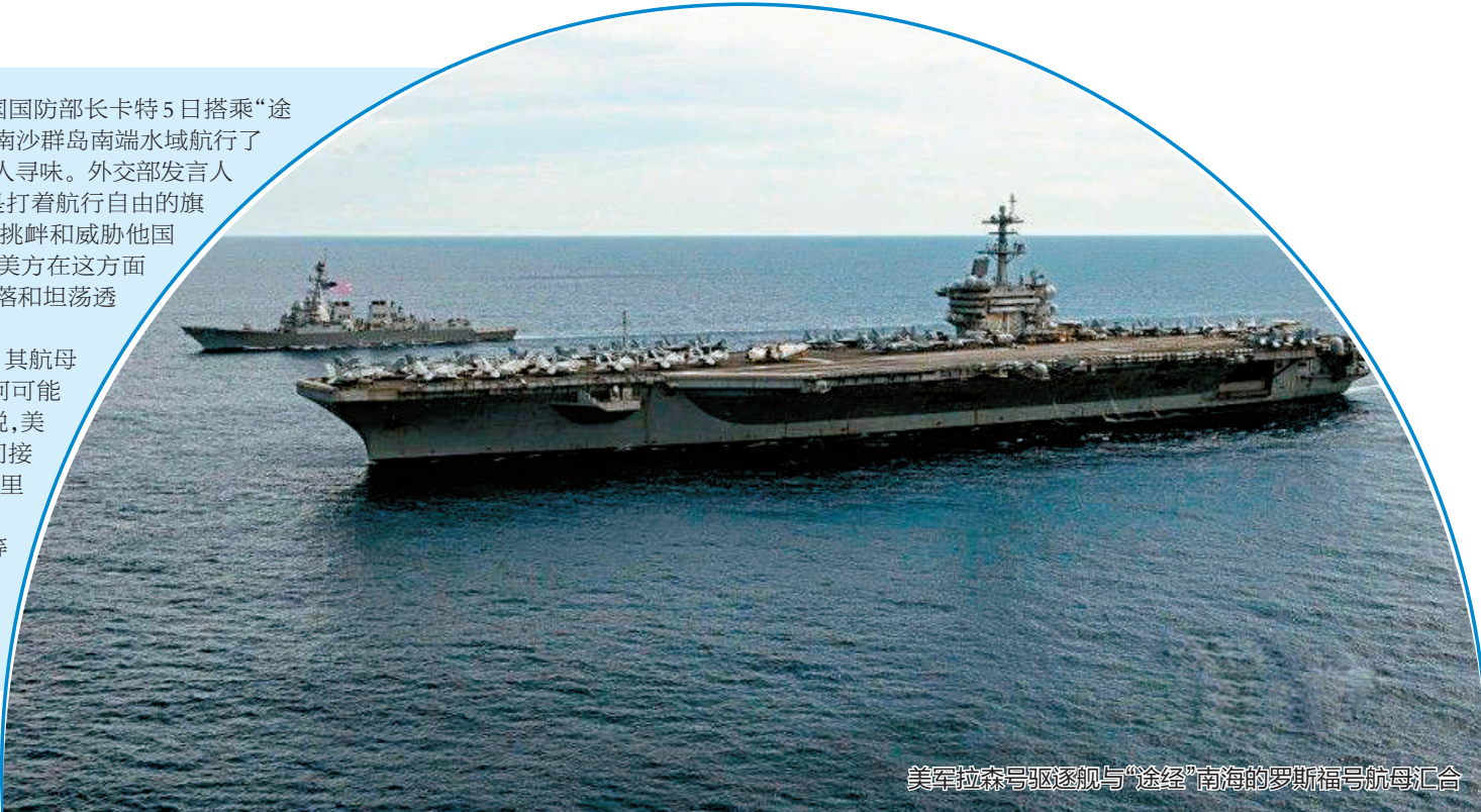
美军拉森号驱逐舰与“途经”南海的罗斯福号航母汇合

美国海军专家认为,中国等潜在对手国导弹武器的快速发展,美国航母不久后可能失去有效性。