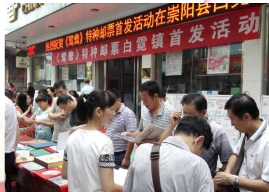
《鸳鸯》特种邮票首发活动受追捧