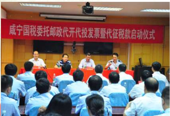
咸宁市国税委托邮政代开代投发票暨代征税款启动仪式