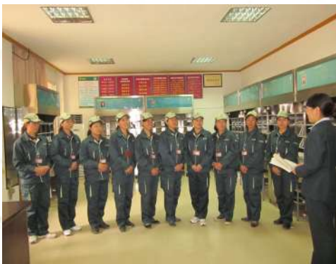
通山女子投递站正在开晨会