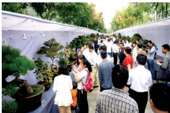
中三角盆景、奇石、根艺展览吸引了不少游客前来观赏。