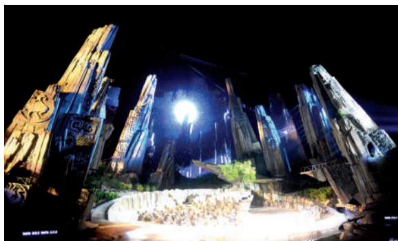
大型实景神话音乐剧《嫦娥》在香泉映月开演。

近几年,市委、市政府把文化惠民放在前所未有的高度,节俭成为实施文化惠民工程的平台和桥梁。