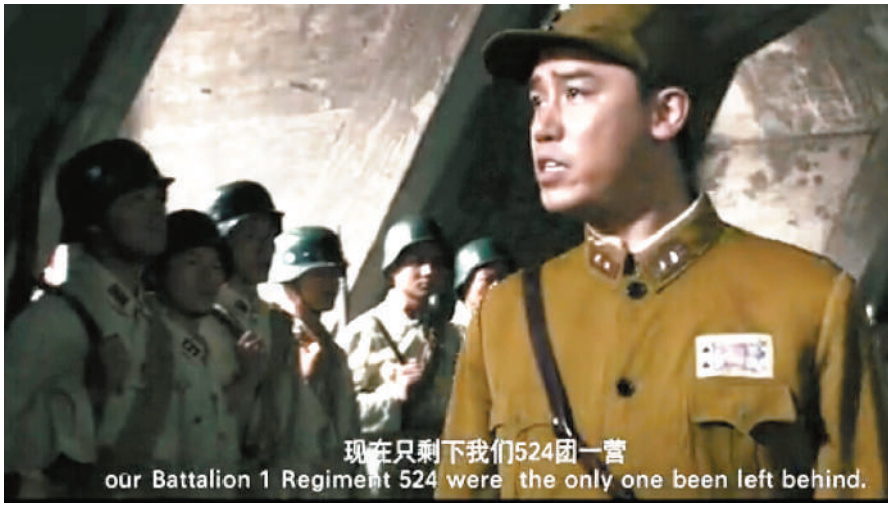
《孤岛离歌》画面截图

淞沪会战中,八百壮士死守孤楼,与日寇力战四昼夜,上演了可歌可泣的四行仓库保卫战。1937年,淞沪会战在四行仓库划下句号,八百壮士断后奋战四昼夜,退入租界孤军营。