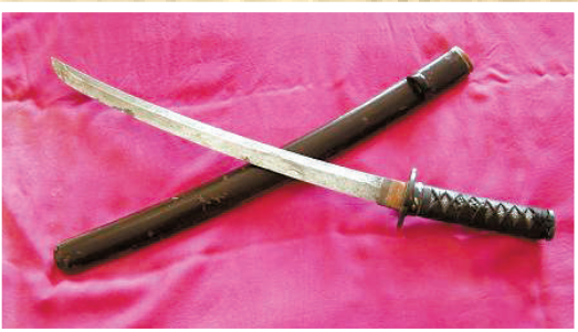
沾满中国人民鲜血的日本军刀