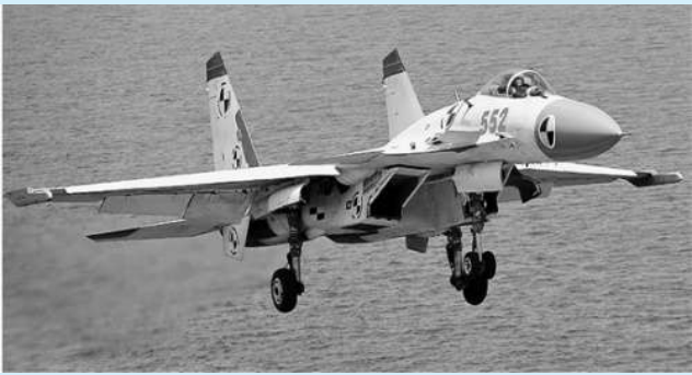
海军歼-15“飞鲨”舰载战斗机