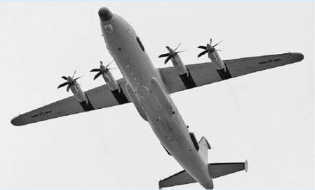
高新八号电子情报机