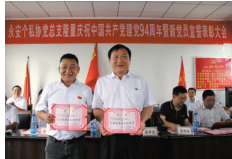
今年“七·一”期间，一批基层党支部受表彰。