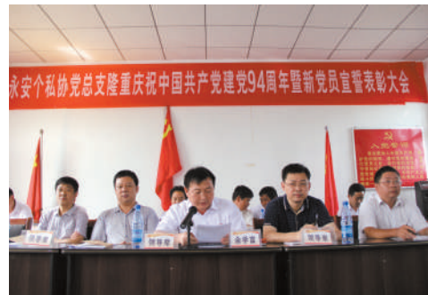
今年“七·一”期间，永安个私协党总支召开庆祝表彰大会。