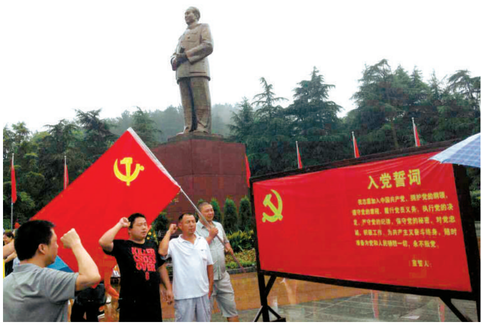
个私协新党员到韶山革命圣地宣誓入党。