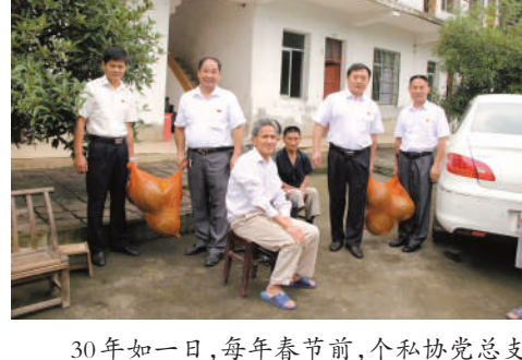
30年如一日，每年春节前，个私协党总支都要前往永安福利院看望孤寡老人。