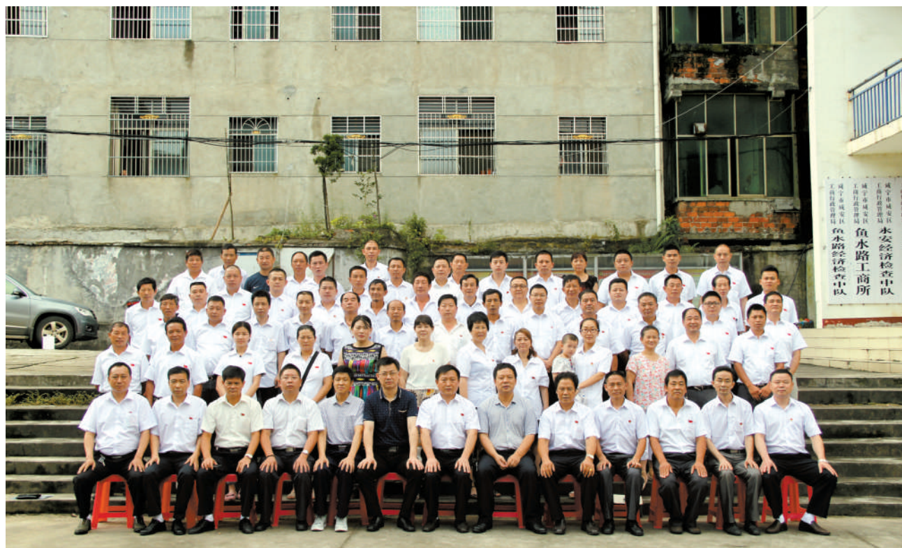
朝气蓬勃的永安个私协基层党员。