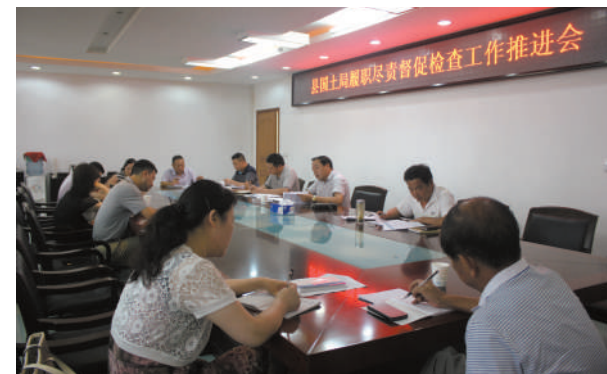
专班推进活动部署