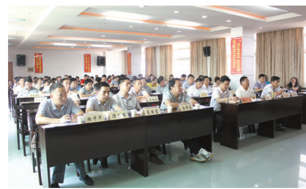
学习省委巡视组讲话精神