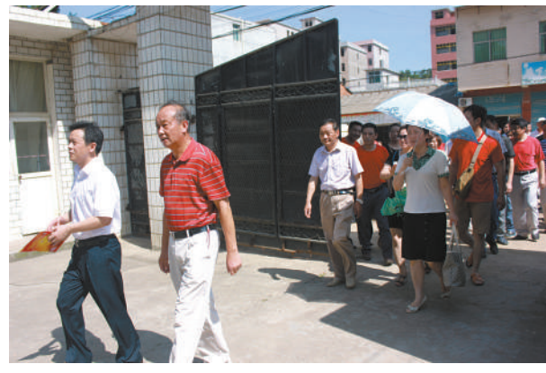
赴看守所接受警示教育