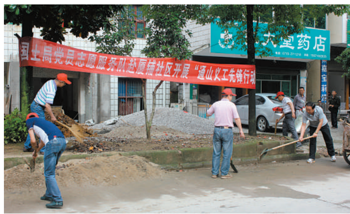
开展党员义工活动

监督举报电话:0715-2360089 举报邮箱:tsgtbgs@sina.com