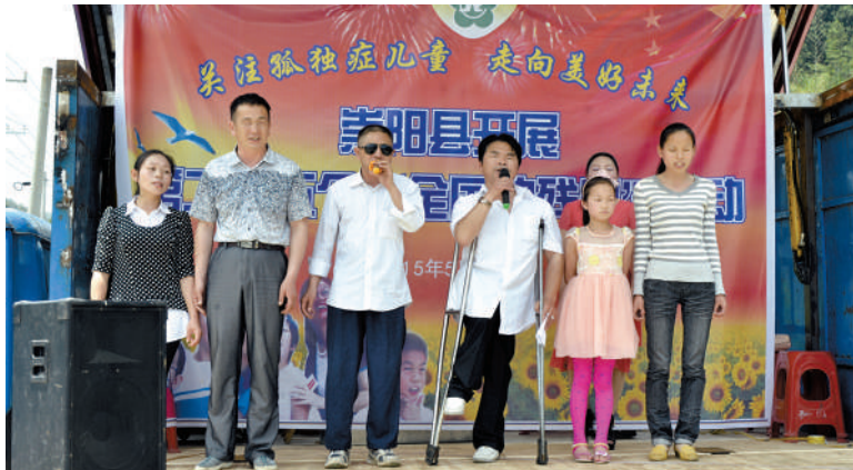
残疾人艺术团合唱《没有共产党就没有新中国》