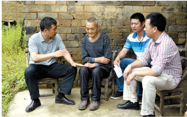
县残联党员干部深入驻点村一对一帮扶