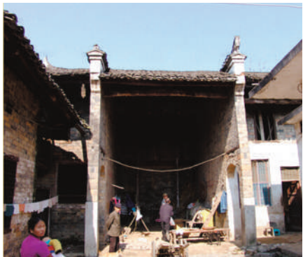
《钟九闹漕》中男主人公钟九的故居