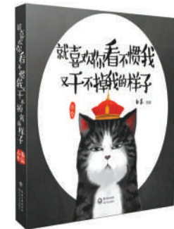
《就喜欢你看不惯我 又干不掉我的样子》 作者:白茶