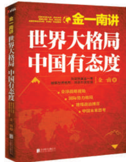
《世界大格局,中国有态度》 作者:金一南