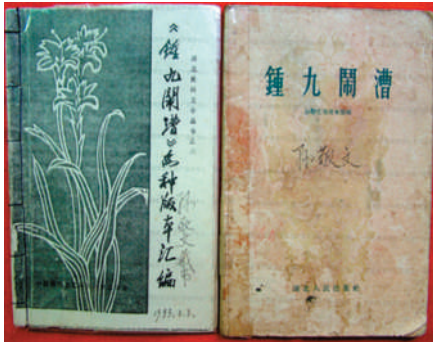
右书为1957年出版的《钟九闹漕》副本

然而,近日记者走访崇阳却发现:这项非遗在崇阳曾经广为传唱,如今却在发祥地遇冷——出现这种情形,究竟是何缘由?