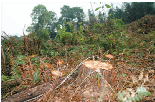
图 为遭盗伐的山林现场

新鲜事 急难事 不平事 开心事 新闻热线 18907249111 您也可以通过新浪微博@咸宁日报社留言