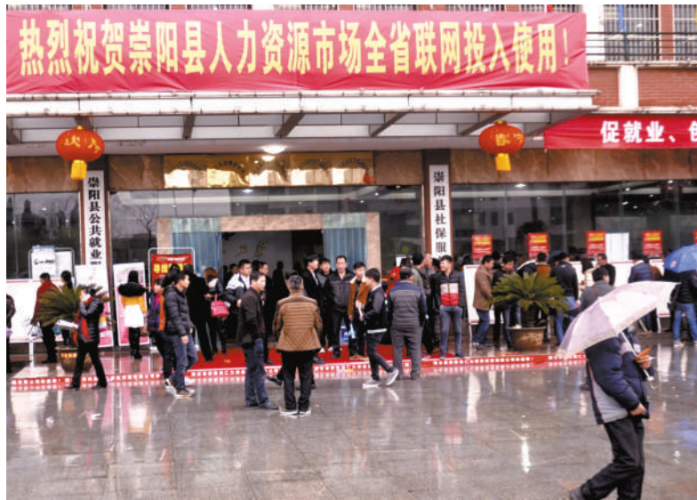
崇阳人力资源市场率先在全市投入使用

并没有阻挡求职者的脚步。场外,接送求职者的车辆还在增加,由各个乡镇干部组织前来的求职者络绎不绝。 据了解,此次招聘会到场企业74家,发布岗位需求信息4020个,涉及工种160多种;到场应聘1.6万人次,签订意向协议2682人,3200人实现登记求职。