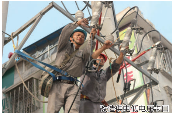
改造供电低电压卡口