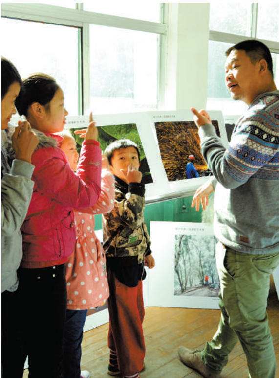
手语交流观展心得

摄影人的责任就是记录,用手里的照相机记录历史、反映时代,就像习总书记说的,要传递真善美,传递向上、向善的价值观,同时引导人们追求讲道德、尊道德、守道德的生活。解决这些问题的办法,就是“扎根人民、扎根生活”。