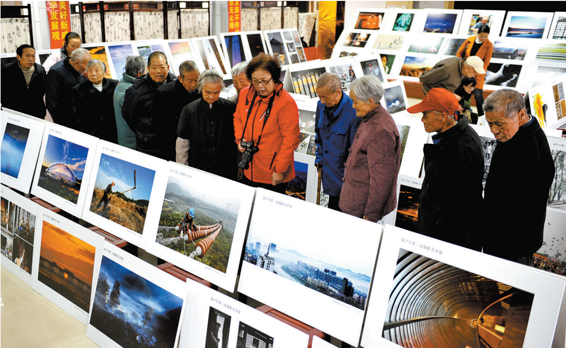
一幅幅展现咸宁山水的作品引人入胜