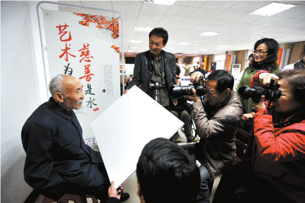
义务为老人拍登记照