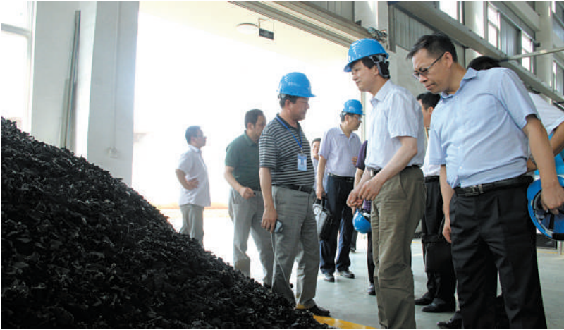
中编办和国家安监总局领导来咸调研职业安全健康

过去的一年,全市安全生产工作在市委、市政府正确领导下,全市各级安监系统认真履行安全监管职责,团结实干,克难奋进,各项工作均取得明显成效。市政府被省政府评为“安全生产工作责任目标考核优秀单位”,全省综合排名第二。今年以来,安监系统进一步转变工作作风,狠抓工作落实,促进了安全生产形势持续稳定好转。安全生产事故起数、死亡人数大幅度下降。1-5月份,全市共发生各类安全生产事故72起,死亡6人,同比分别下降36.3%和40%。全市各项安全生产指标均控制在省政府下达控制范围内,各县(市、区)均控制在市政府下达控制范围内。