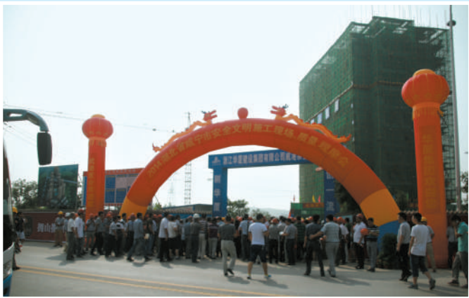
安全生产月活动现场