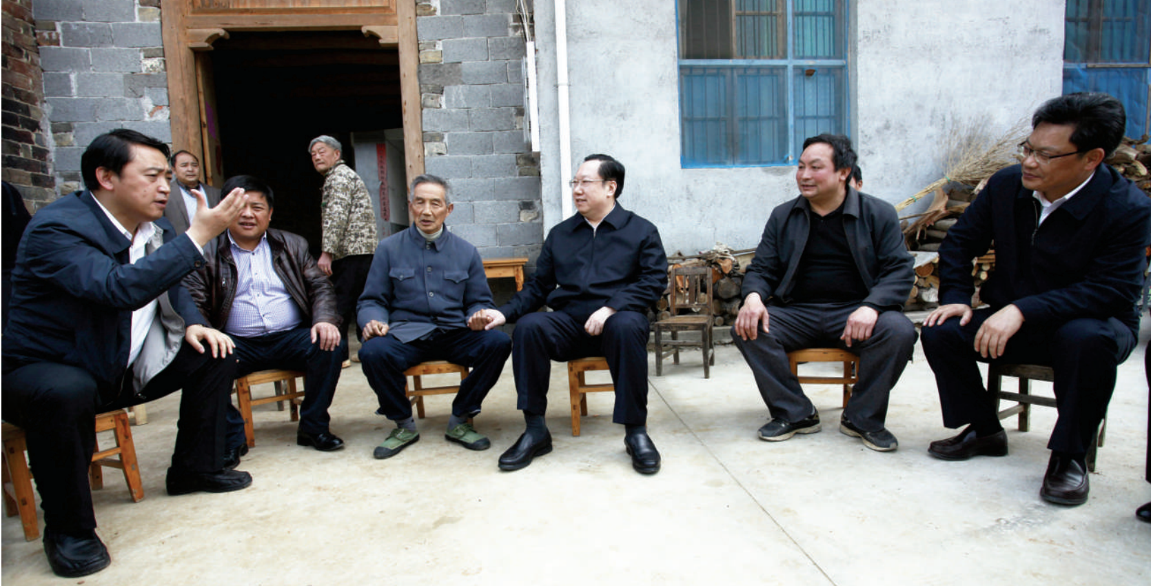
省委常委、常务副省长王晓东(右三)深入铜钟村听取群众意见

公车私用,通报曝光;以权谋私,依法严惩;“关系”低保,严肃清查;交通拥堵,立马整治……哪壶不开提哪壶,崇阳县群众路线教育实践活动——