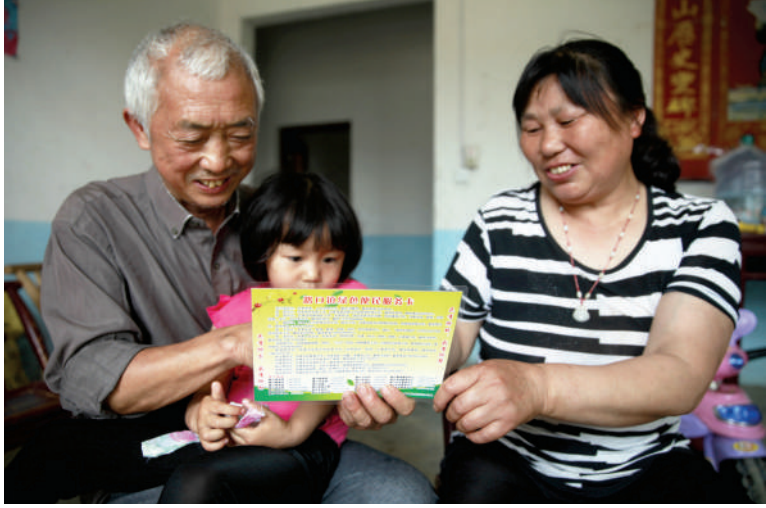
路口镇村民喜领便民服务卡