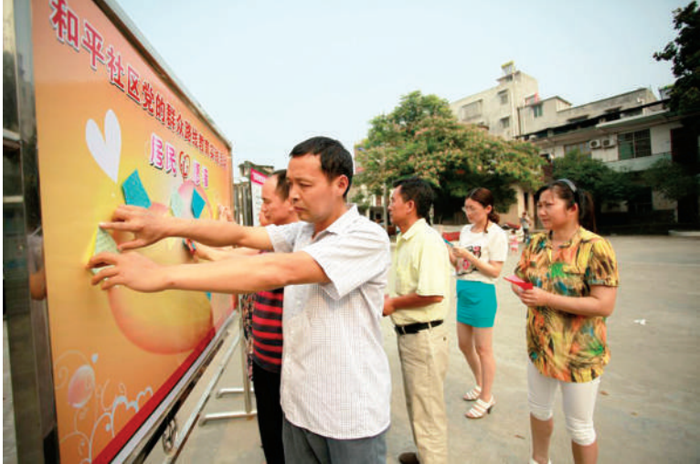
天城社区居民张贴“微心愿”