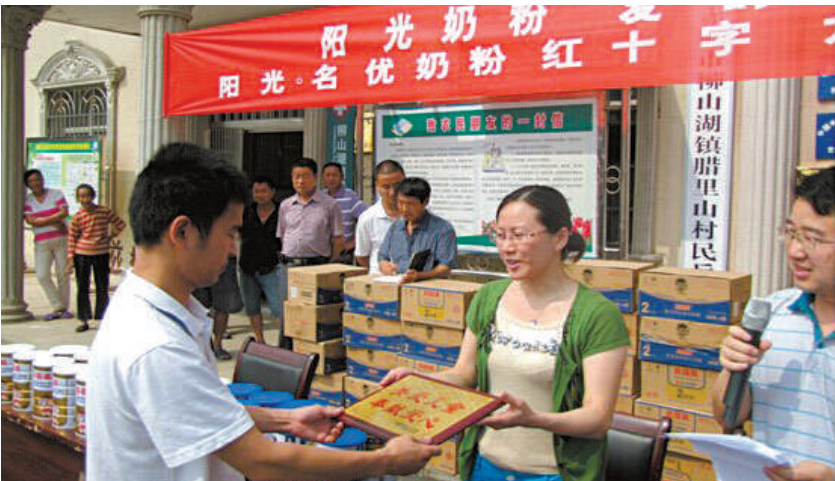
6月4日,赤壁市红十字会举行“‘阳光奶粉 爱的奉献’红十字六一公益行”首发式,来自赤壁市、嘉鱼县、通城县的三家名优奶粉店共捐赠价值30万元的奶粉,免费送给该市550名贫困儿童、留守儿童。