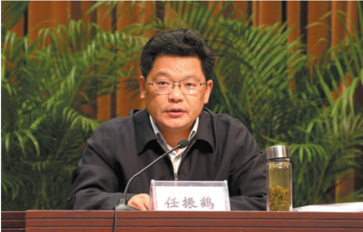
市委书记任振鹤出席创建国家环保模范城市动员大会