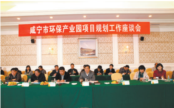
市委副书记、市长丁小强在环保产业园项目规划座谈会上讲话