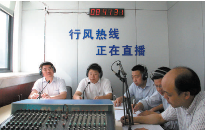
市环保局干部解答市民关注的环境热点问题