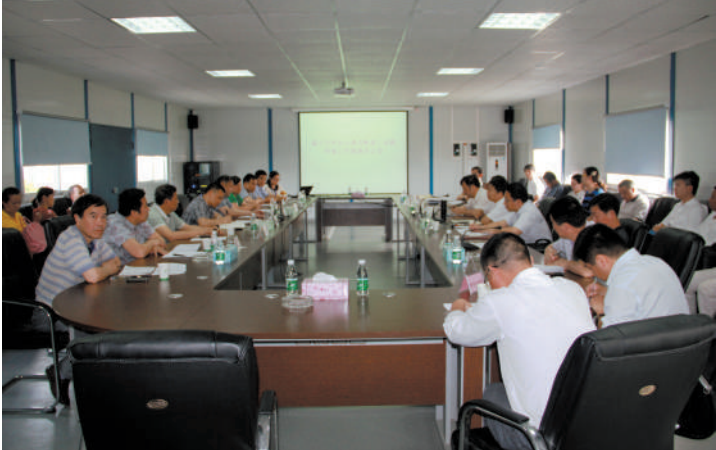
市环保局主持召开潘家湾吸湖工业园环保工作现场会