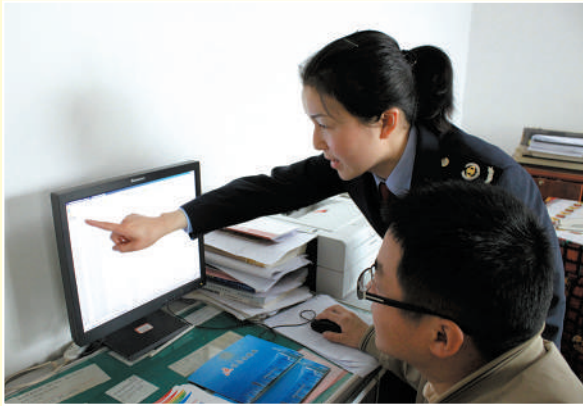
辅导企业人员办税