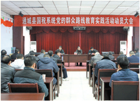
召开党的群众路线教育实践活动动员会

通城县地处幕阜山区,中小企业所占比重较大,该局日常税收征管中发现这部分企业财务制度不健全、成本核算有漏洞、内部控制混乱等现象严重,企业涉税风险程度相对较高。为此,该局结合涉税风险监控指标分析,分行业、分层次开展企业风险防范辅导和应对,促进企业管理规范。一是日常监测找准风险。采取案头审核和日常下户相结合的方式,借助地税、工商、银行等第三方有效信息,对企业生产经营、税收增减、产品价格变动、工资发放等情况进行动态比对和分析,根据行业特点,查找各个行业的税收风险点,发现异常及时向企业发布预警信息。二是分类辅导应对风险。对重点税源企业以辅导涉税处理为主,对企业重大涉税实施前置纳税辅导,提前介入企业涉税处理过程。对中小型企业以提供政策辅导为主,定期收集整理纳税人咨询的涉税问题,丰富纳税人获取税收政策的渠道。对个体工商户以提高其依法纳税意识为主,通过不定期开展税法宣传,辅导其正确处理财务和税务问题。三是后续管理化解风险。开展税源专业化管理,分行业建立风险企业一户一档管理办法,实时监控重要涉税指标,帮助企业自查自纠,及时化解涉税风险。并收集整理企业常见的涉税疑点问题,开展风险企业典型推介活动,对各行业涉税风险形成原因、严重后果及防范重点进行通报,帮助企业规避风险,走良性发展之路。