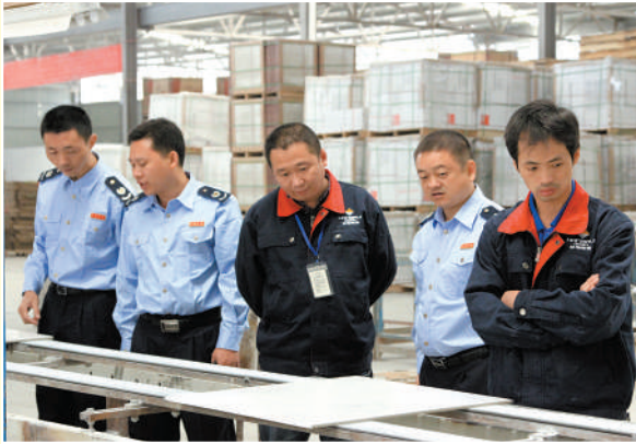
税收管理员了解企业生产经营情况