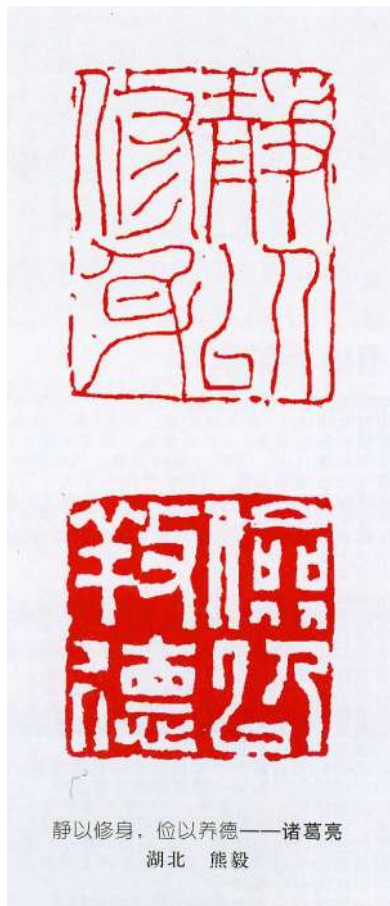
静以修身,俭以养德——诸葛亮 湖北 熊毅