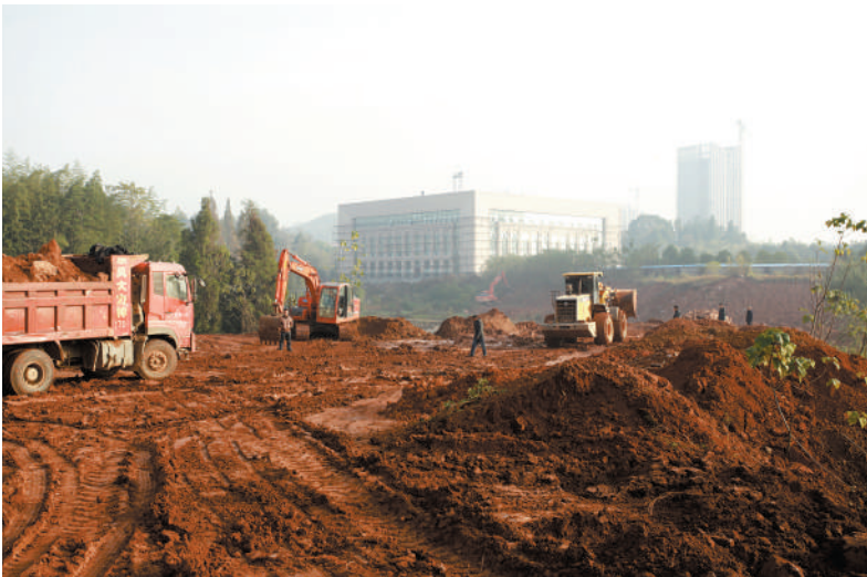
大集广场二期施工现场