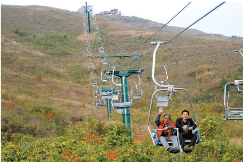
正在试运营的三特索道