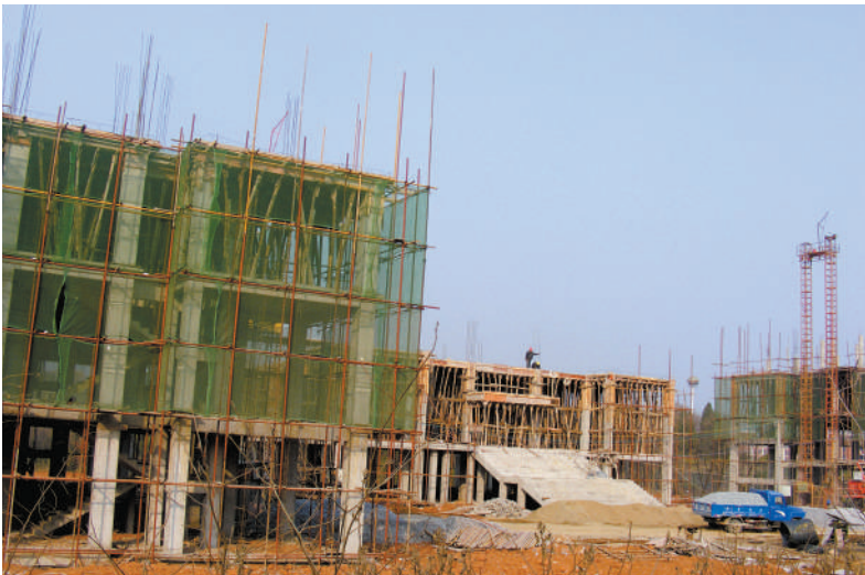
县委党校建设现场