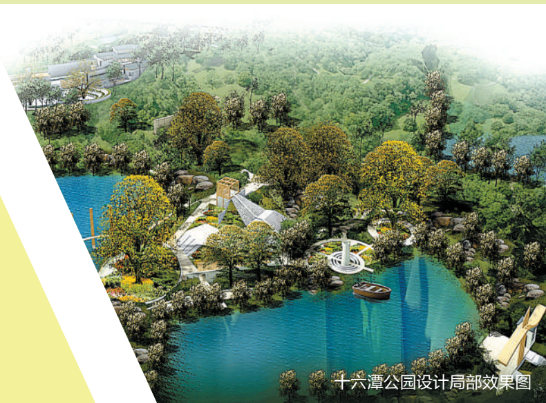
十六潭公园设计局部效果图