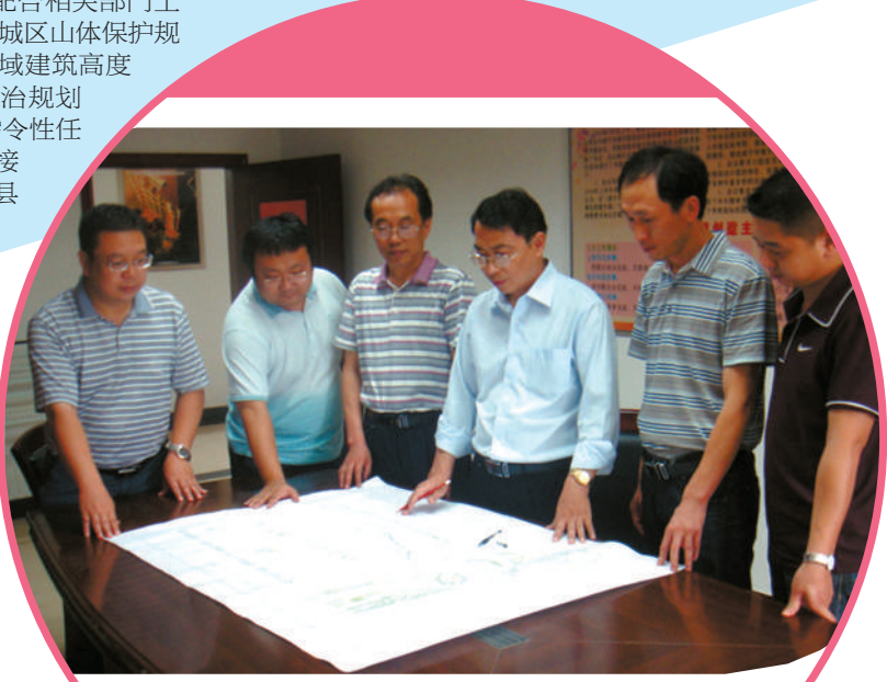
咸宁市规划设计院领导专家们在评点图纸

回首过去,成果丰硕。展望未来,踌躇满志。在建设鄂南强市的伟大进程中,市规划设计院全体干部职工将以更优、更新、更精的服务理念为新时期的发展目标,在竞争中寻求空间,在竞争中不断提升,在竞争中寻求发展。为创建省内一流的规划设计单位而不懈努力,为咸宁的绿色崛起,早日实现鄂南强市的“咸宁梦”而努力奋斗!