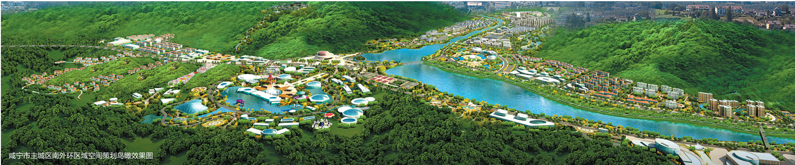
咸宁市主城区南外环区域空间策划鸟瞰效果图