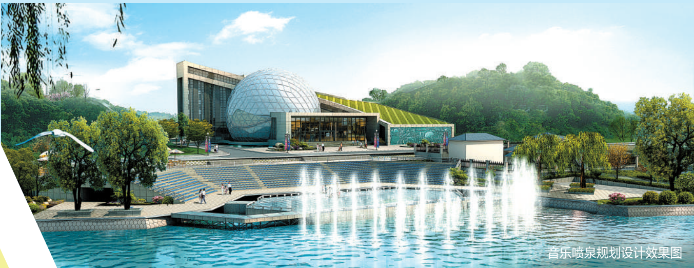
音乐喷泉规划设计效果图

城市发展,规划先行。多年来,咸宁市城市规划设计院始终坚持“质量立院、科技兴院、人才强院”的企业理念,以质量求发展,向管理要效益,一切与市场接轨,全心全意地为客户服务。加快转变经济发展方式,在观念创新、技术创新、制度创新上谋发展。努力打造观念现代化、管理正规化、技术信息化、队伍专业化的人才队伍。为我市的城乡规划事业作出了突出贡献,多次在省、市优秀规划设计评选中获奖,受到了有关专家、领导和广大市民的一致好评。