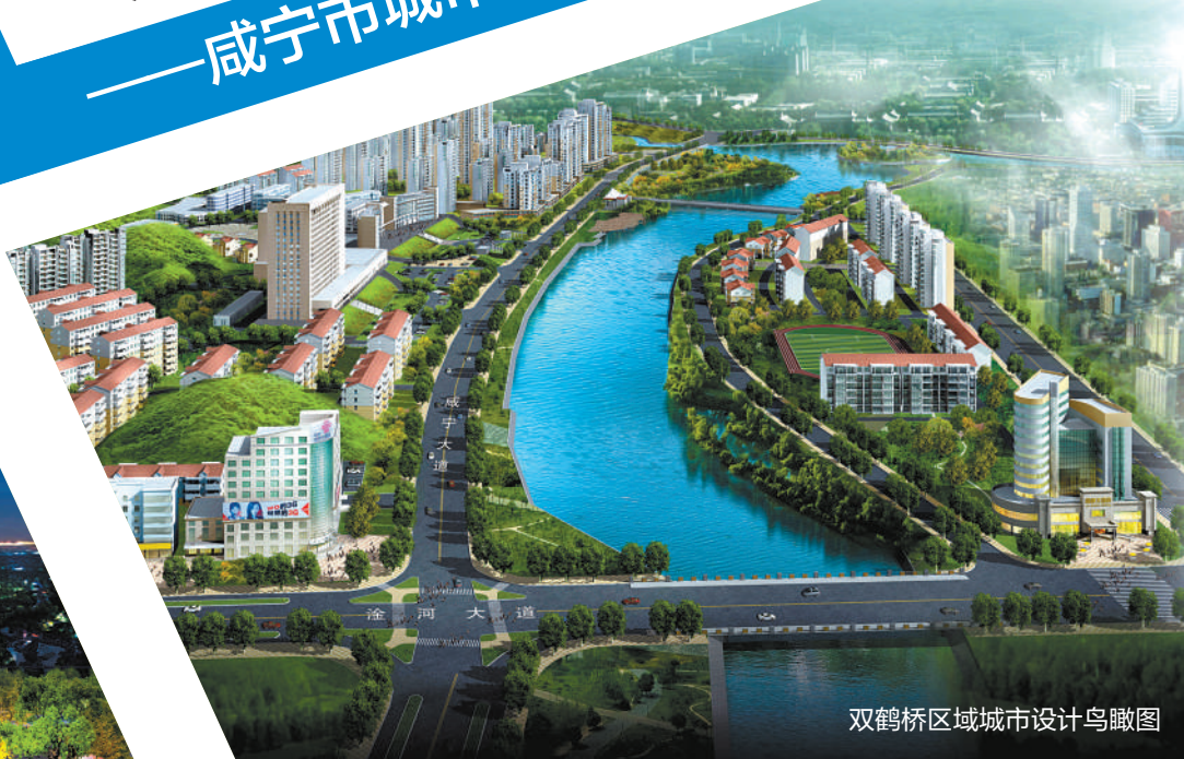
双鹤桥区域城市设计鸟瞰图