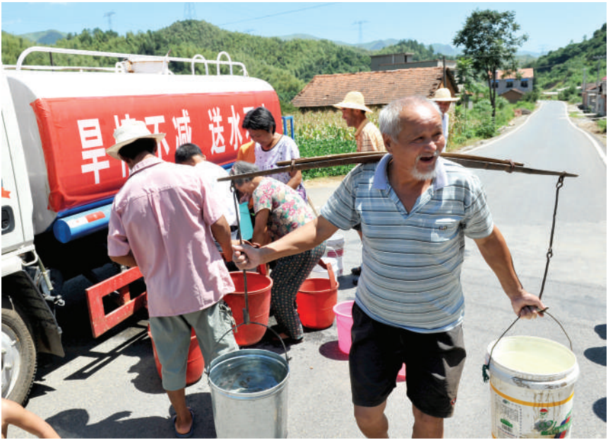
昨日，通山抗旱送水服务队为群众送去洁净水。 针对连续干旱造成 6 万多人饮水困难的实际，该县成立抗旱送水服务队，每天分赴通羊、黄沙、慈口等乡镇，为群众送水近 200 车、700 余吨。